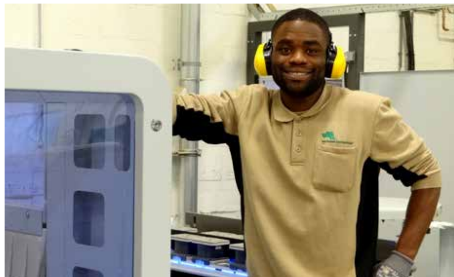
Proteus IBT heeft zich naar tevredenheid bewezen en voldoet nog steeds aan onze huidige wensen.